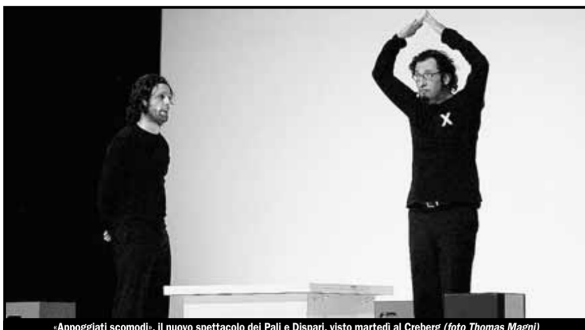
«Appoggiati scomodi», il nuovo spettacolo dei Pali e Dispari, visto martedì al Creberg

I due attori-autori milanesi (hanno scritto lo spettacolo con Fabrizio Testini, per la regia di Paolo Migone) rappresentano, con un umorismo spesso surreale, sovente astratto, la crisi di un giovane che si scopre prossimo papà. Rappresentano, cioè, una fase di passaggio. E qualcosa di molto meno scontato: il solito racconto umoristico di una differenza (il rapporto lui-lei o genitore-figlio) basa il suo gioco sul contrasto di posizioni definite e immutabili. Qui invece viene messa in gioco un'identità che si scopre inadeguata, e deve evolvere. Appoggiati scomodi (già il titolo è una gag: rimanda alla precarietà della generazione dei neo-padri) non riesce fino in fondo a trasformare questa materia in teatro, e teatro comico per giunta.