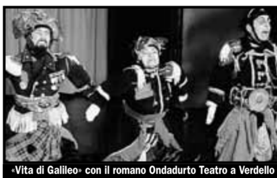
«Vita di Galileo» con il romano Ondadurto Teatro a Verdello

Urgnano e dintorni: tre proposte di qualità nel calendario di «Experimenta»